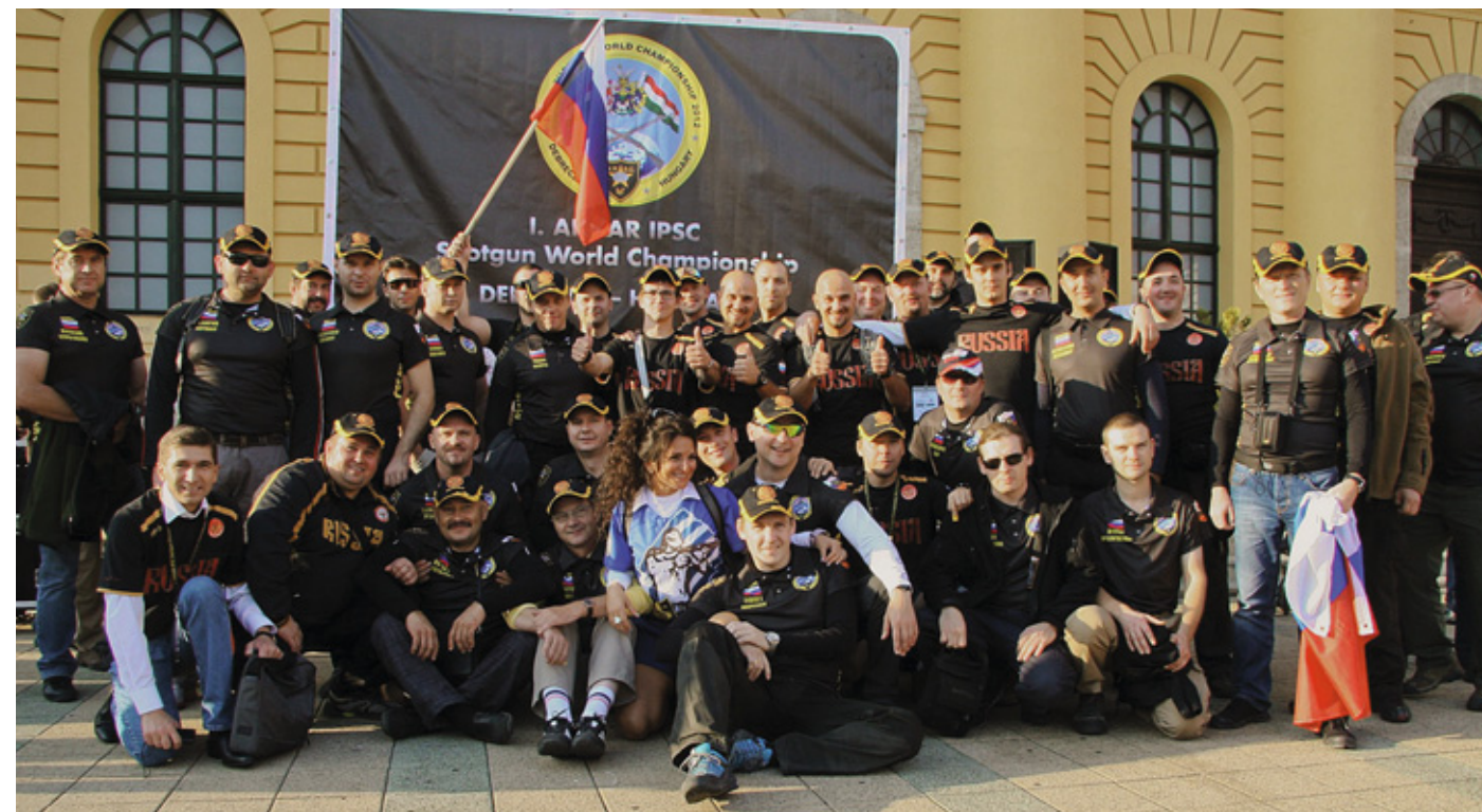
Небывалый в истории успех российской делегации на первом чемпионате мира по практической стрельбе из ружья 2012 года – 28 призовых мест почти во всех дисциплинах и категориях и 5 золотых медалистов!

В целом прошедший год можно назвать ещё одним этапом на пути поступательного развития практической стрельбы в России и он доказал, что наши стрелки могут занимать высшие ступени пьедестала на соревнованиях самого высокого уровня.